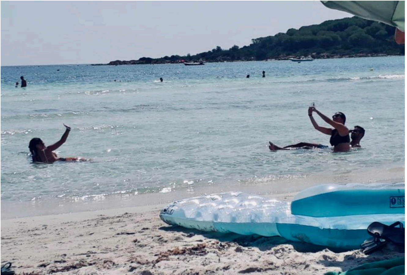
Whale watching irgendwie anders.