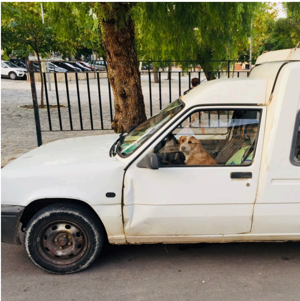
*Die Beule war schon..“

Man muss die Augen eben nur offen halten, um das Gute zu sehen. Sowohl die