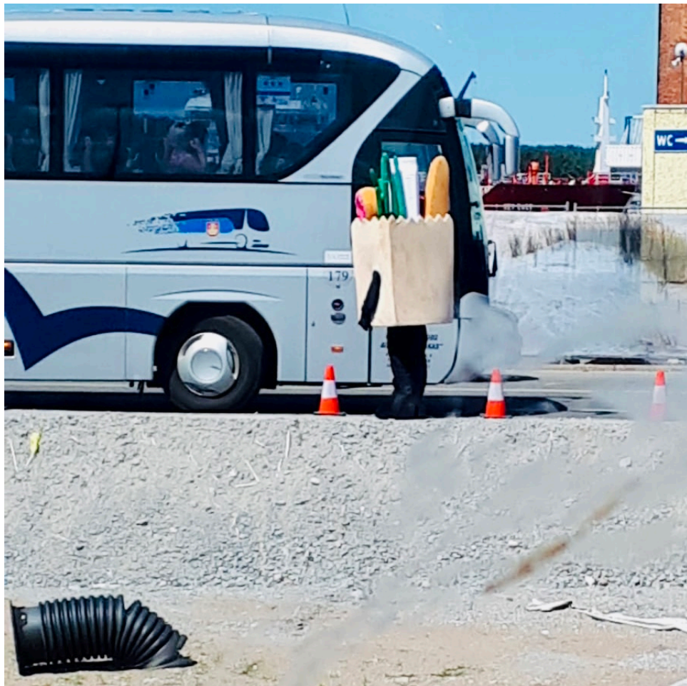
Junges Gemüse, hinten.

Kein Grund zum Lachen haben Menschen, die starben, Schmerzen erleiden oder ihren Halt im Leben verlieren. Alle anderen haben noch genügend Gründe zum Lachen. Diese zum Beispiel: