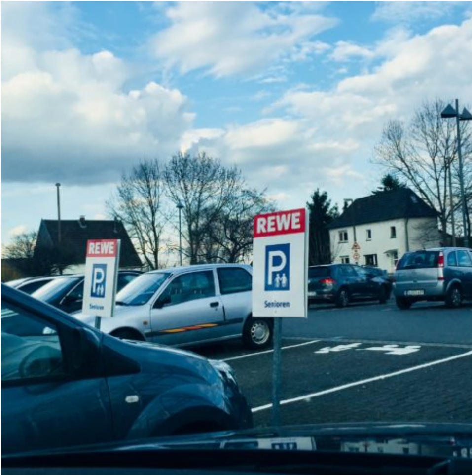
Frauen, Kinder und nun auch alte Leute zuerst - vorm Rewe.