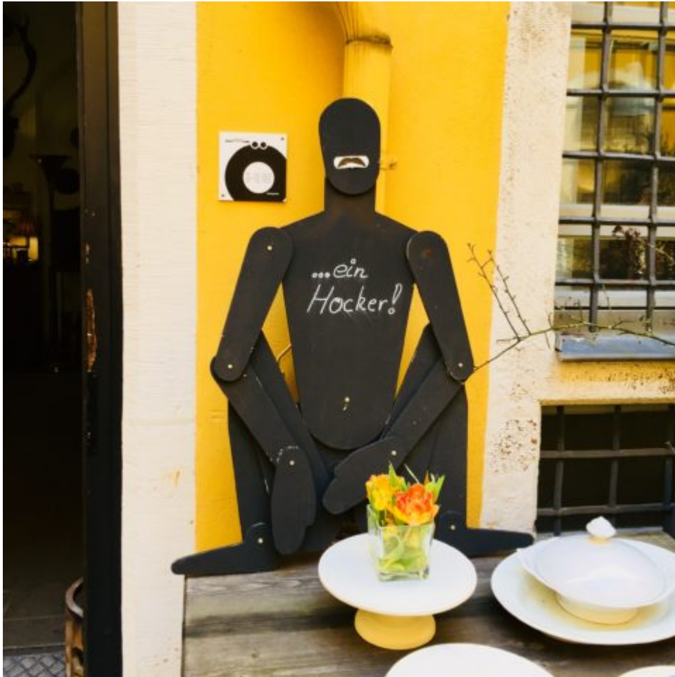
Ein Hocker zum Niederknien.