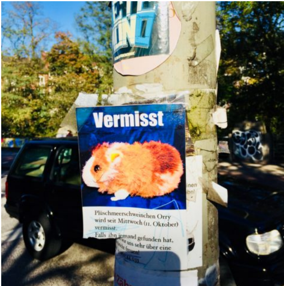
Wo ist Orry? Dramatische Bilder in Hamburg Eimsbüttel. Plüschtier entflohen.